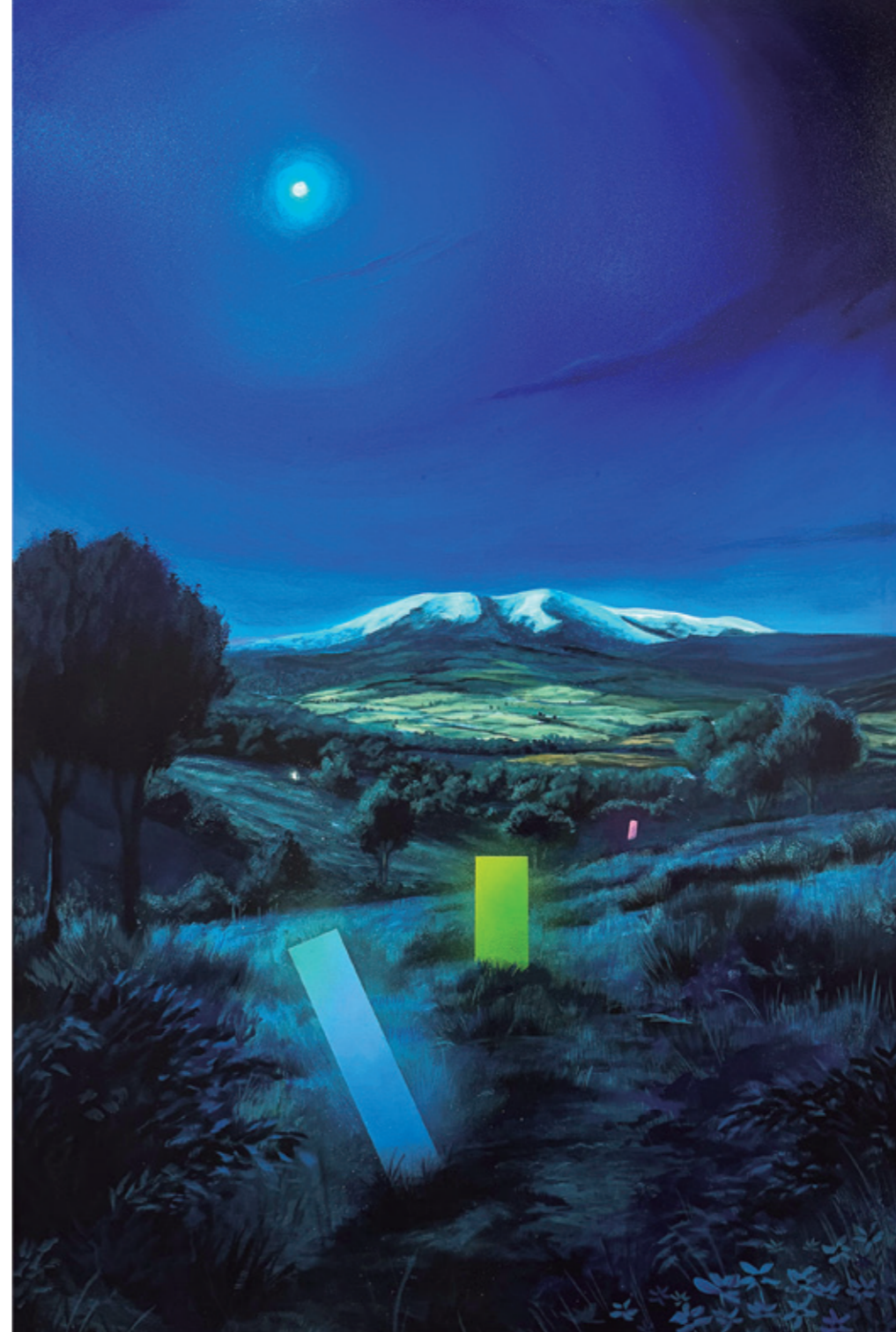
La serenata, 2024 Pintura plástica, spray y pastel sobre lienzo. 130 x 190 cm