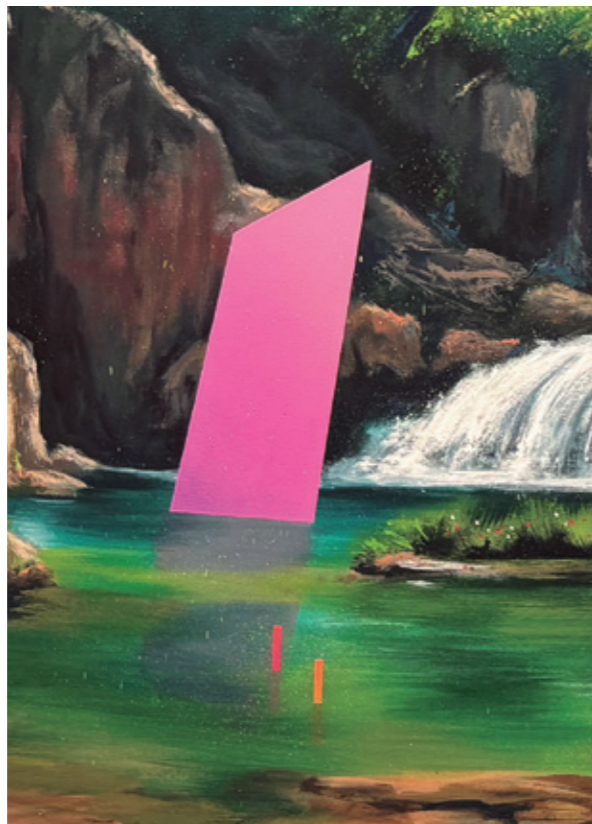
Los Espejismos (detalle), 2024 Pintura plástica, spray y pastel sobre lienzo. 300 x 150 cm