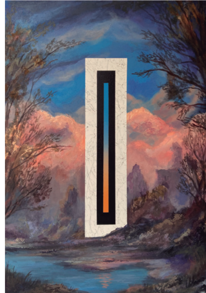
Encuentro, 2021 Acrílico sobre tabla 50 x 70 cm