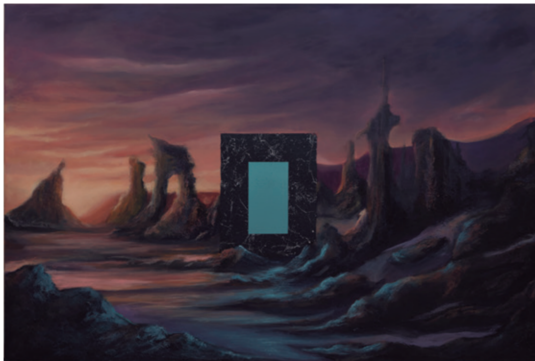
Paisaje invadido III, 2021 Acrílico sobre lienzo 90 x 60 cm