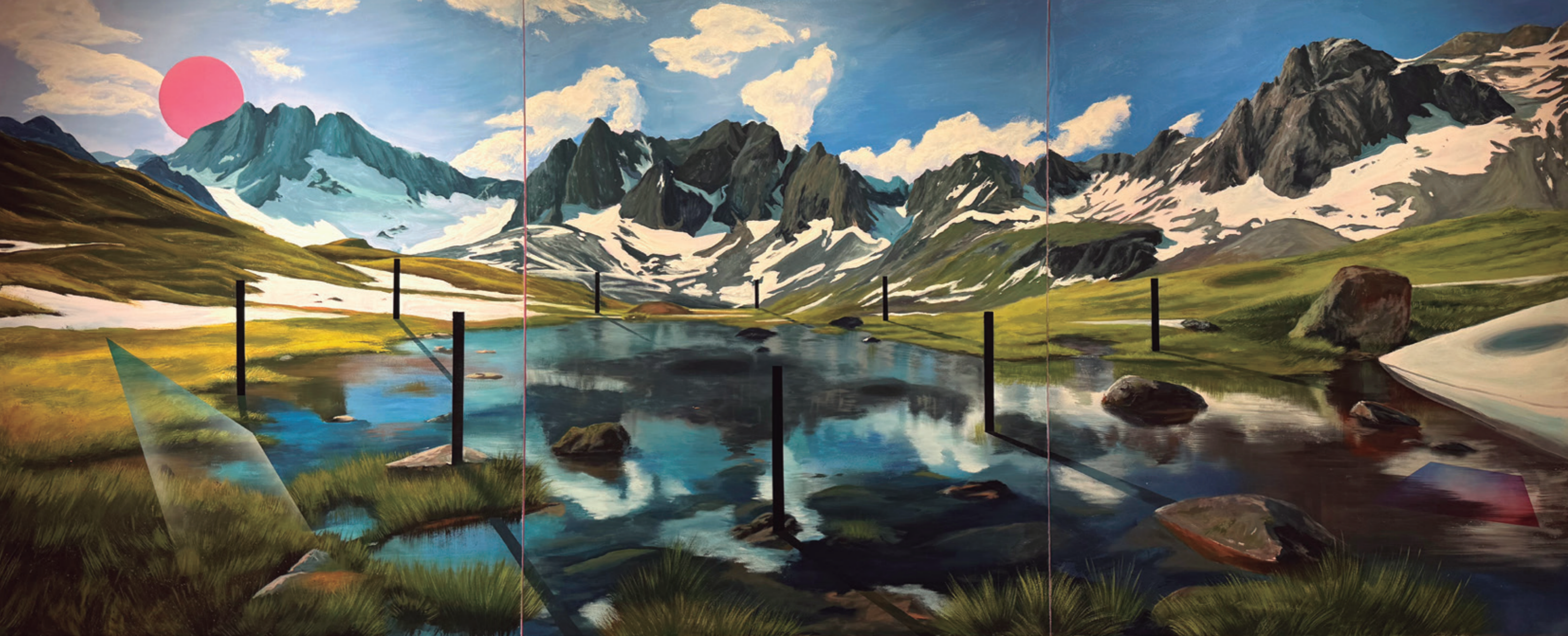
El baño de Pirene, 2024 Pintura plástica, spray y pastel sobre lienzo. 390 x 160 cm