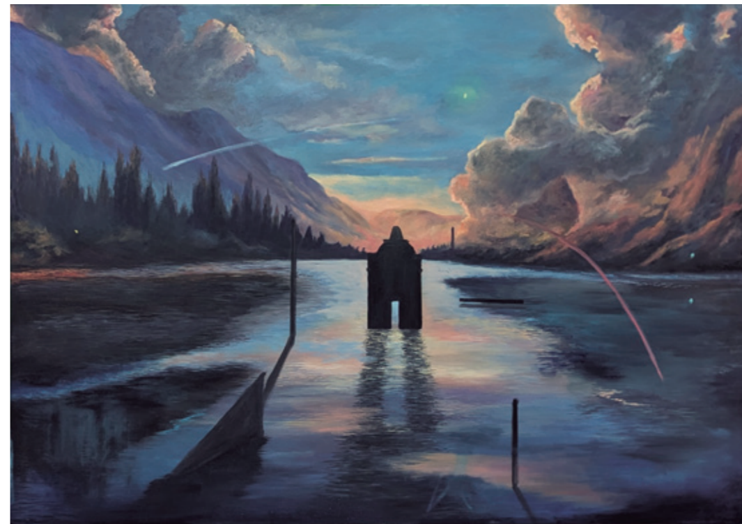
Mediano, 2024 Óleo sobre lienzo 116 x 86 cm