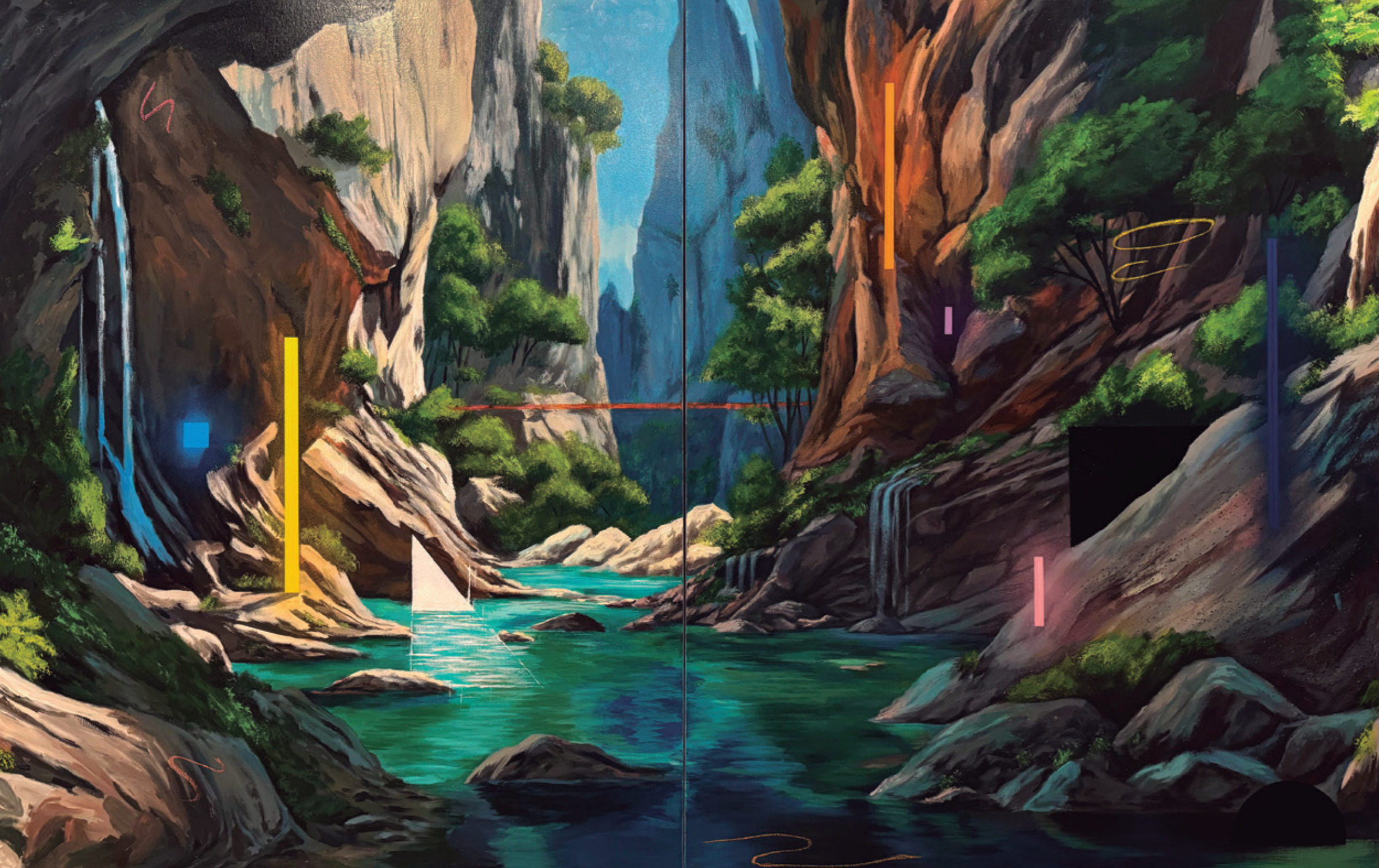
Cañón de las formas, 2024 Pintura plástica, spray y pastel sobre lienzo. 228 x 146 cm