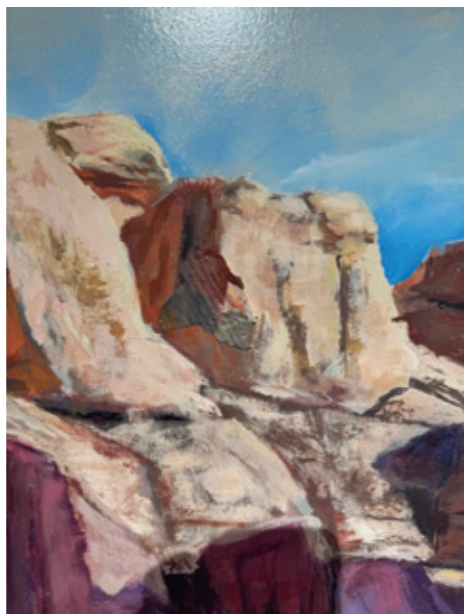
Monumento a la gran sequía (detalles), 2024 Pintura plástica, spray y pastel sobre lienzo. 300 x 150 cm