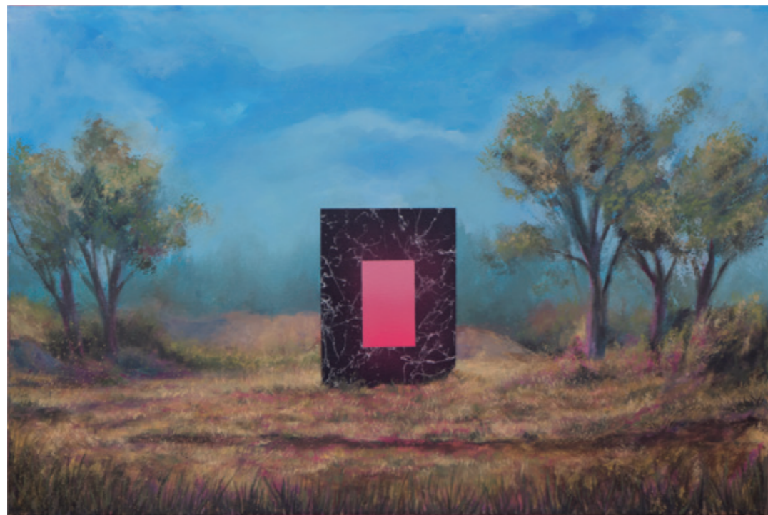
Paisaje invadido V, 2023 Acrílico sobre lienzo 90 x 60 cm