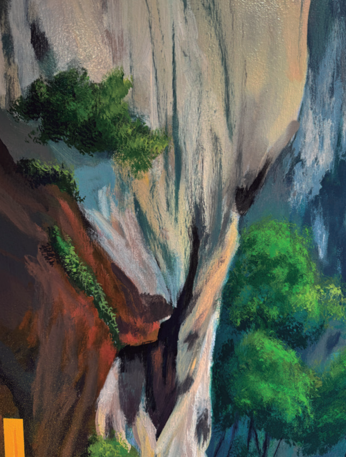
Cañón de las formas (detalles), 2024 Pintura plástica, spray y pastel sobre lienzo. 228 x 146 cm