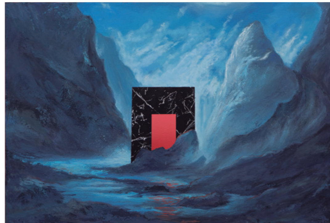
Paisaje invadido I, 2021 Acrílico sobre lienzo 90 x 60 cm