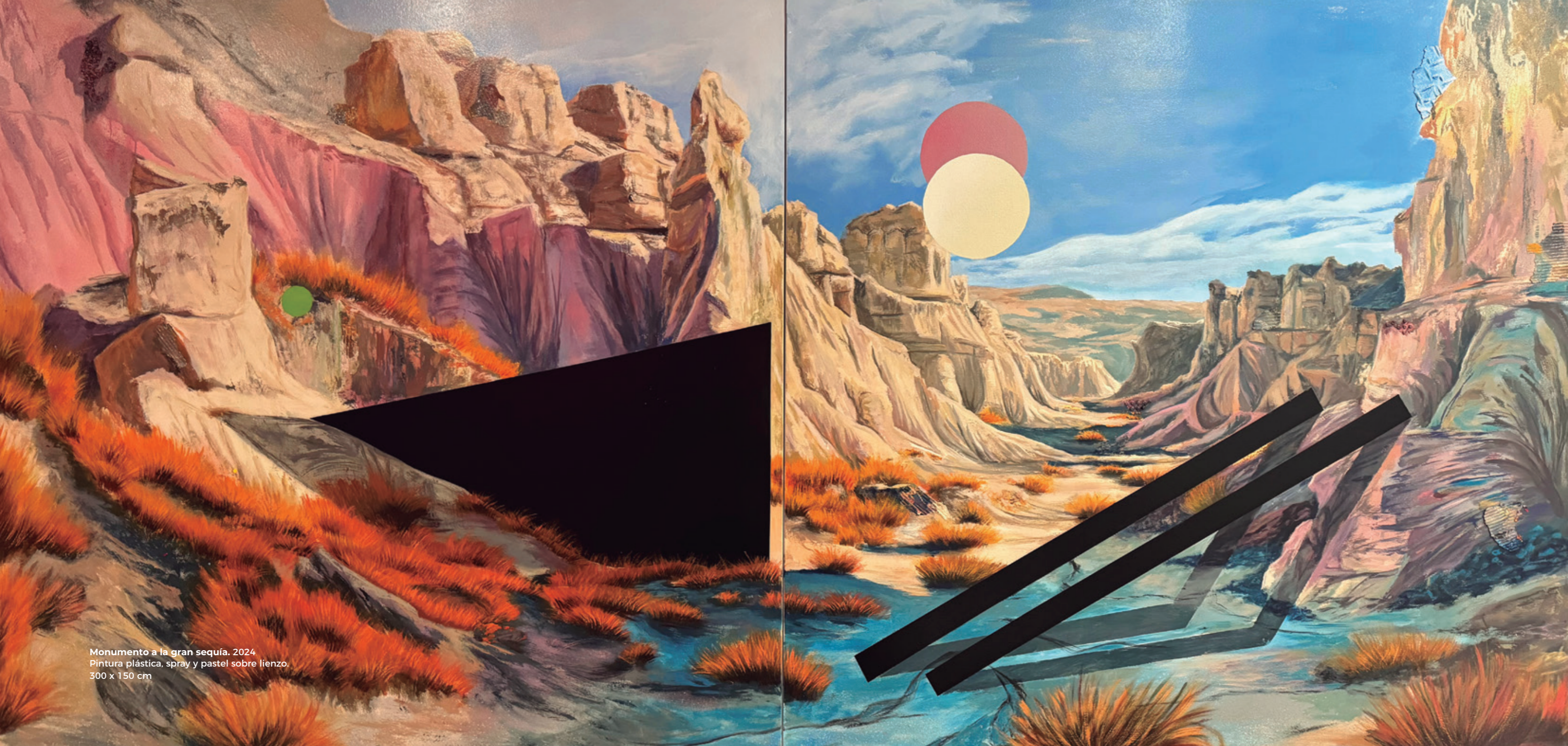
Monumento a la gran sequía. 2024 Pintura plástica, spray y pastel sobre lienzo. 300 x 150 cm