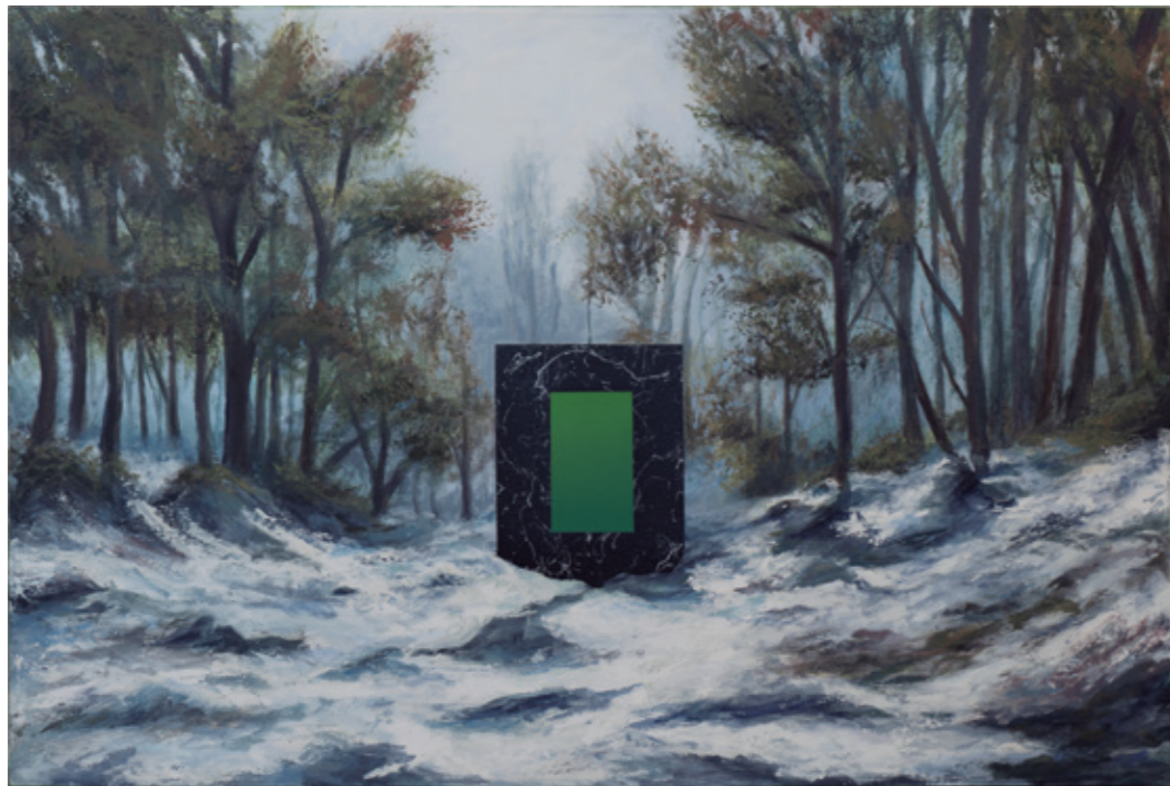
Paisaje invadido IV, 2021 Acrílico sobre lienzo 90 x 60 cm