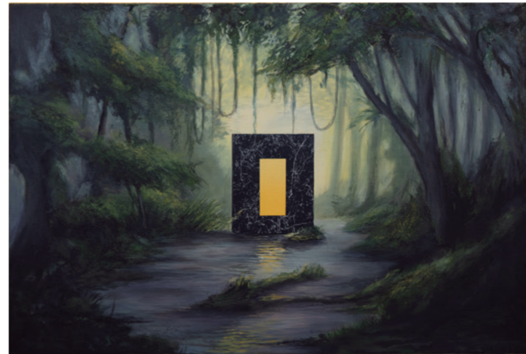
Paisaje invadido II, 2021 Acrílico sobre lienzo 90 x 60 cm