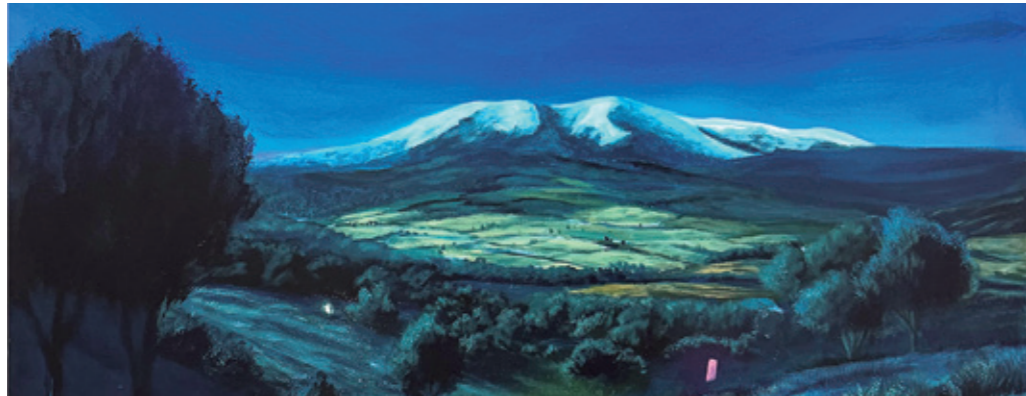
La serenata (detalle), 2024 Pintura plástica, spray y pastel sobre lienzo. 130 x 190 cm