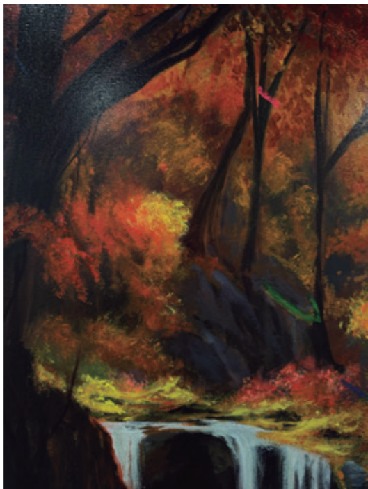
Declive del arroyo Pintura plástica, spray y pastel sobre lienzo. 180 x 180 cm. 2024