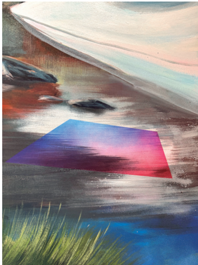
El baño de Pirene (detalles), 2024 Pintura plástica, spray y pastel sobre lienzo. 390 x 160 cm