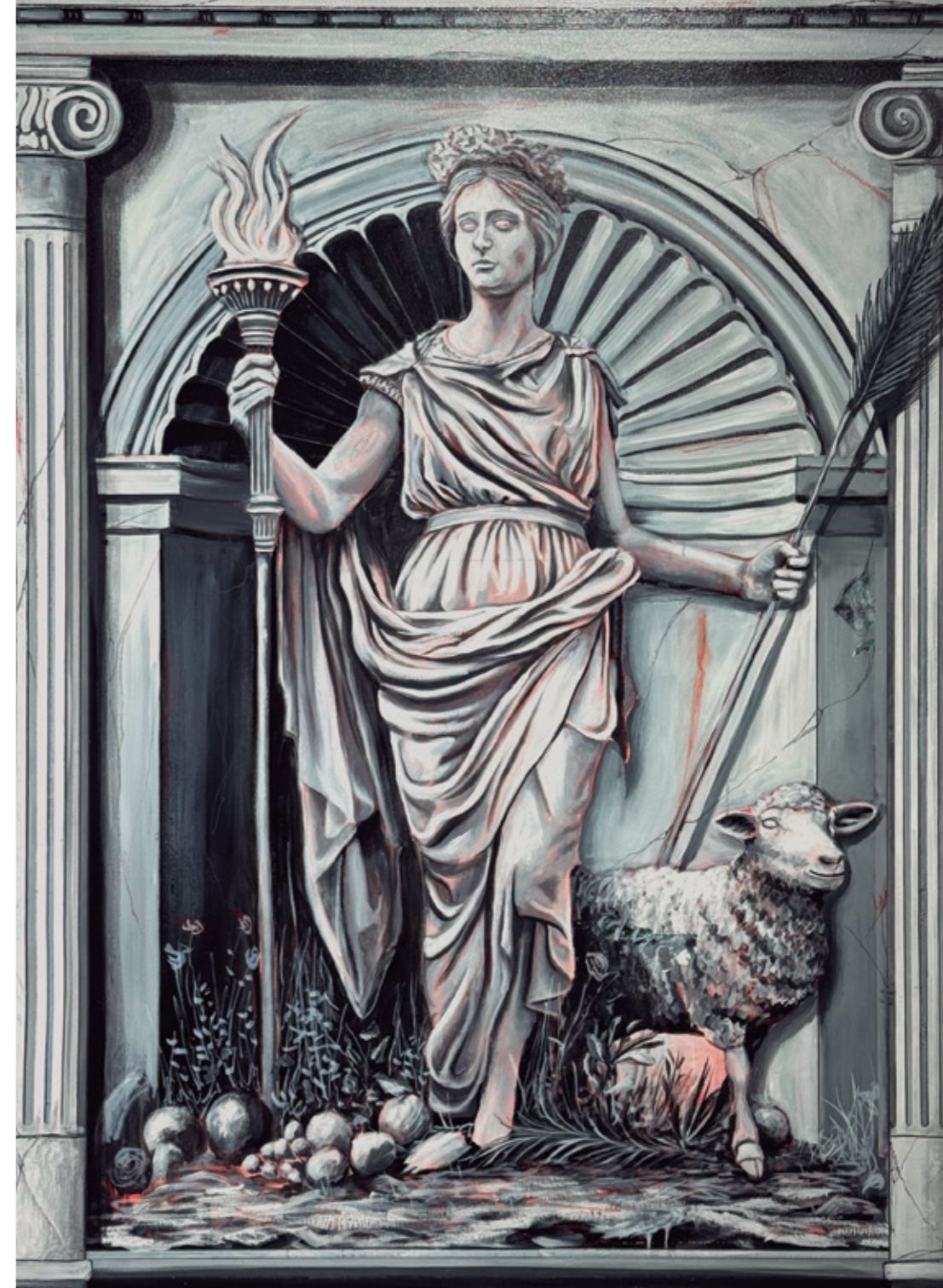
Démeter, 2024 Pintura plástica y pastel sobre lienzo. 114 x 146 cm