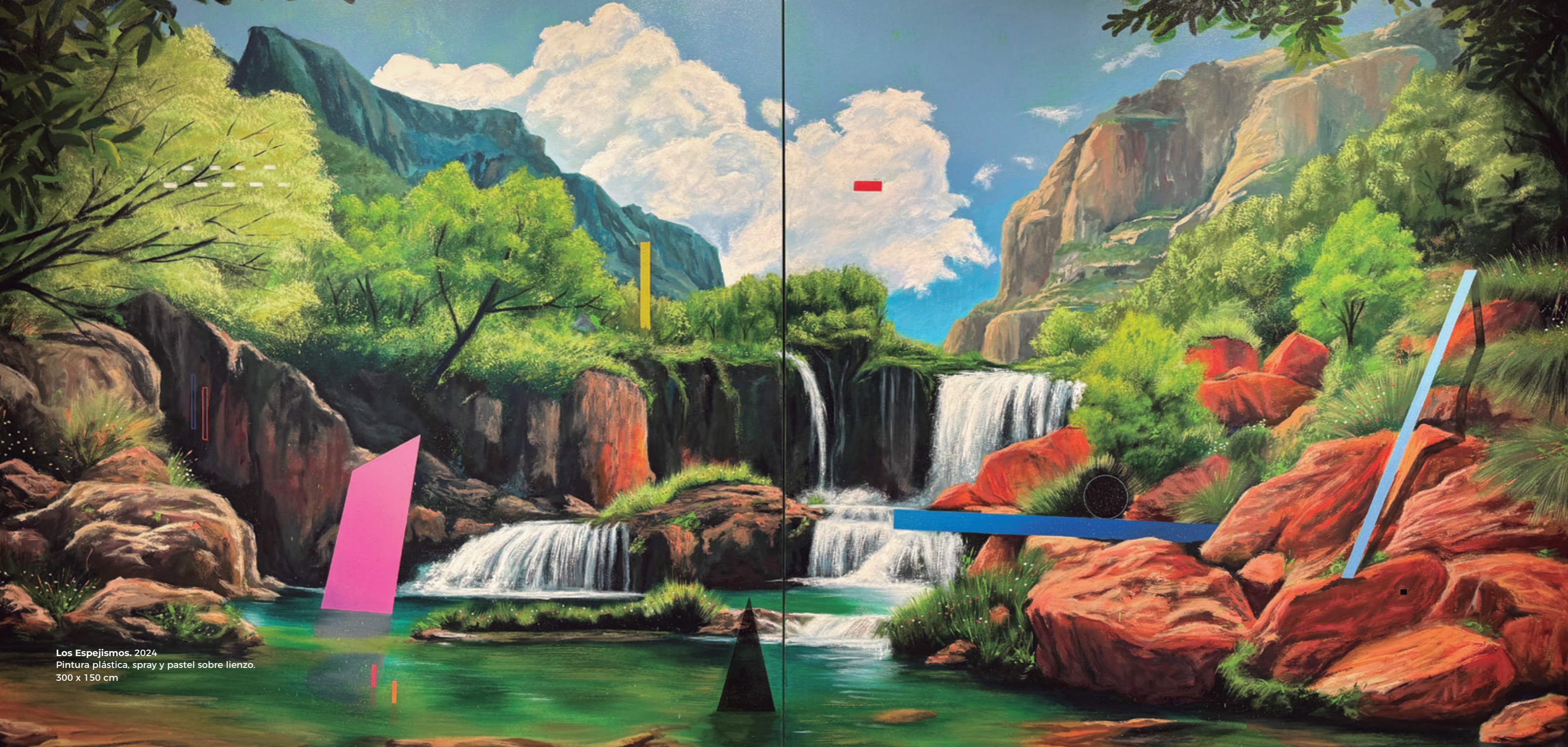
Los Espejismos. 2024 Pintura plástica, spray y pastel sobre lienzo. 300 x 150 cm