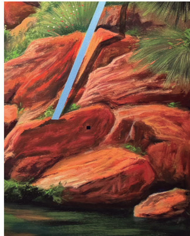
Los Espejismos (detalle), 2024 Pintura plástica, spray y pastel sobre lienzo. 300 x 150 cm