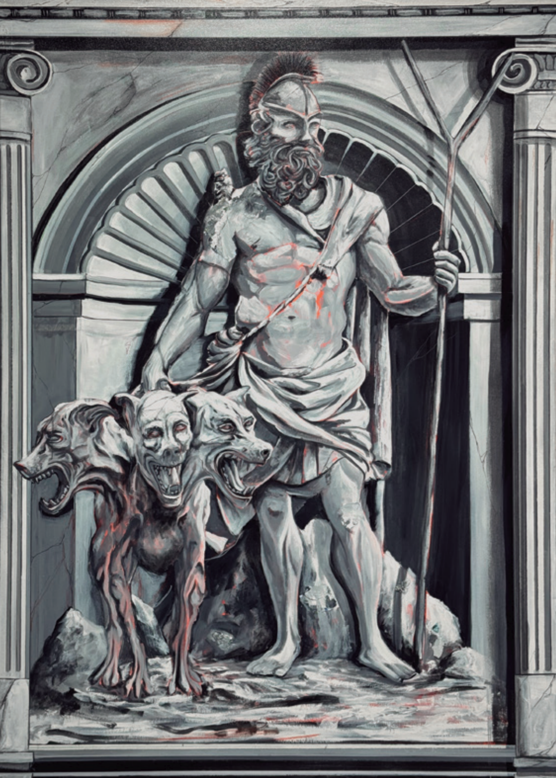
Hades, 2024 Pintura plástica y pastel sobre lienzo. 114 x 146 cm