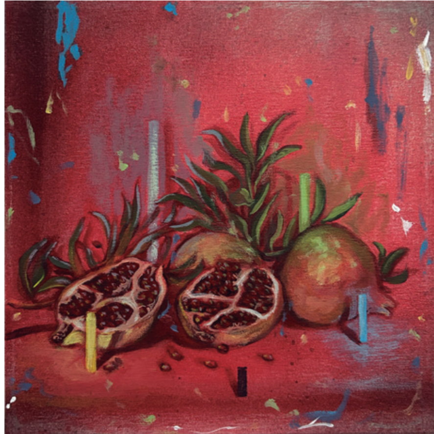
Granadas III, 2025 Pintura plástica y spray sobre lienzo 30 x 30 cm