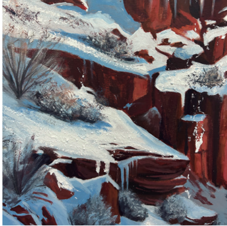
Refugio de los orbes, 2024 Pintura plástica, poliuretano y pastel sobre lienzo. 200 x 200 cm